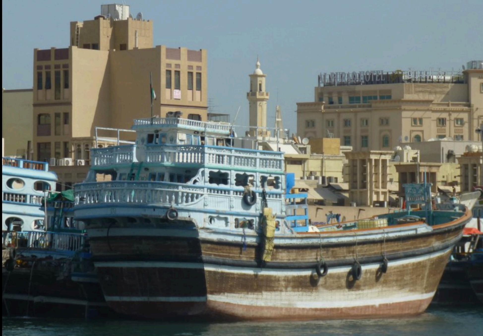
Khor Dubai - Dubai Creek - Deira Souk