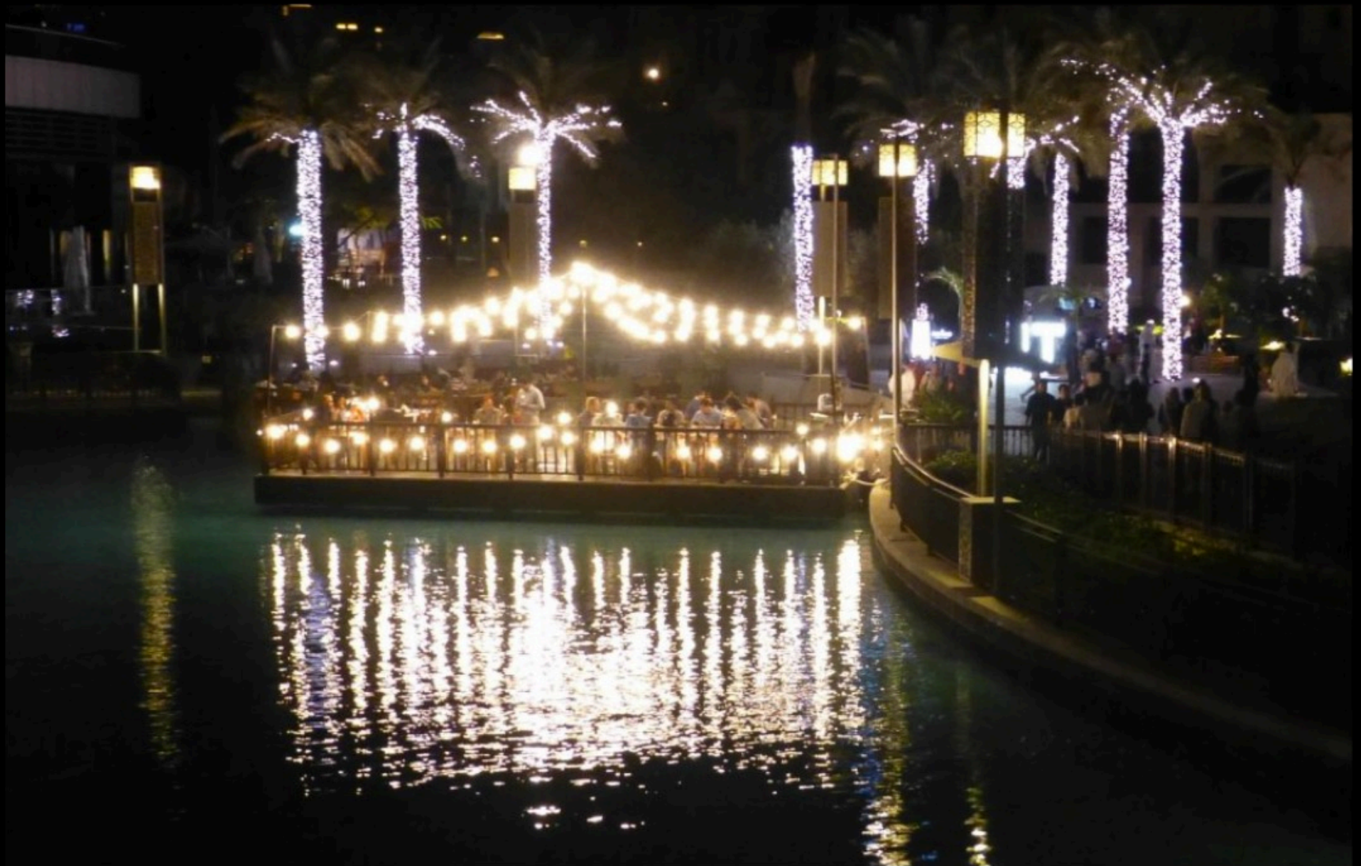
Burj Khalifa Island Park